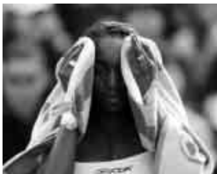
Las rutinas durante los cambios de lado son importantes para la concentración

Como la pérdida de concentración puede deberse a la falta de forma física, el entrenador ha de tener en cuenta el nivel físico del jugador. Para ello es importante que el entrenador trabaje con el jugador para asegurarse de que la forma física de este está, como mínimo, equilibrada frente a las exigencias de la competición.