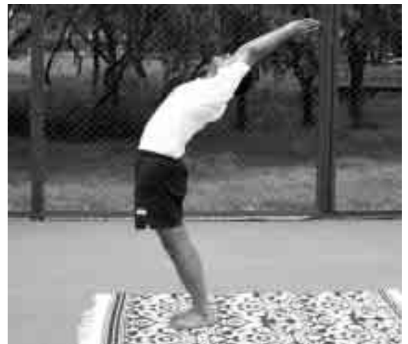
Posición 2 de Sunyanamaskar