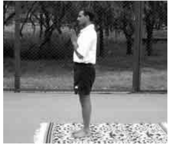
Posición 1 de Sunyanamaskar