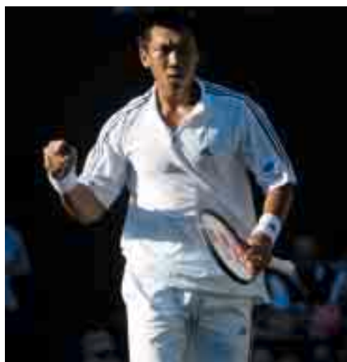
El deseo del jugador es fundamental para alcanzar un alto rendimiento en competición

El 13º Simposium Mundial de la ITF para Entrenadores se celebrará en el Dom Pedro Golf & Conference Centre, en Vilamoura, Portugal, del lunes 20 al domingo 26 de octubre de 2003 y contará con la colaboración de la Federación Portuguesa de Tenis. Por favor consulten el interior de este número si desean encontrar más información sobre el programa provisional. ¡Esperamos verles allí!