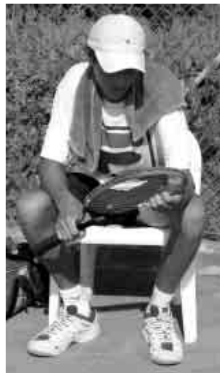
Los cambios de lado son cruciales para focalizar la atención

Cómo trabajan los entrenadores con sus jugadores para que comprendan mejor ese