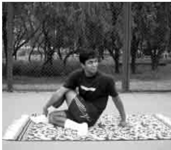
Flexión media de la columna