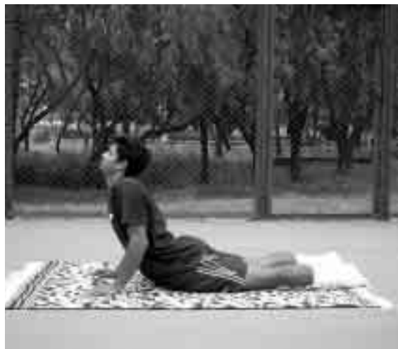
Posición de la cobra

facilitar el equilibrio mental durante y entre los partidos, al tiempo que aumenta el bienestar y la capacidad regenerativa del jugador. De una forma más amplia, los beneficios del yoga durante esta fase se pueden resumir en: