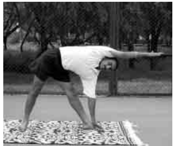
Posición del triángulo