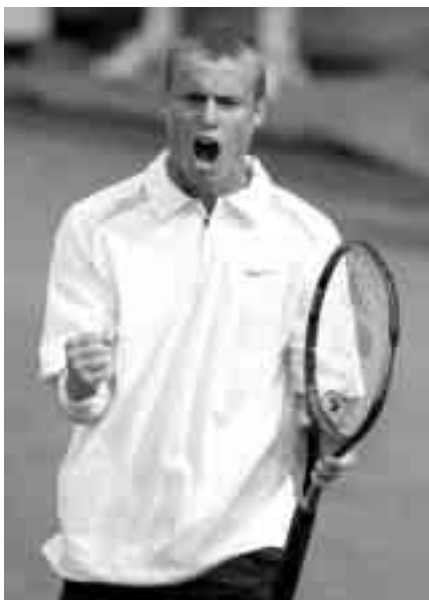
El tenis a nivel mundial es un asunto serio para los jugadores

Divertirse y aprender a "amar" el tenis es lo que caracteriza esta fase. Además, el individuo es libre para practicar y "explorar" muchos deportes, para experimentar con éxito actividades que supongan poca presión y para recibir ánimos de padres y entrenadores.