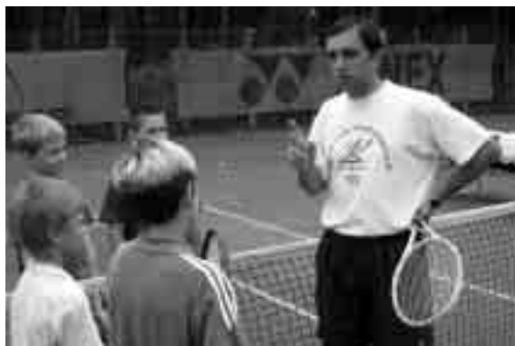
Los objetivos eficientes ayudan a adquirir nuevas estrategias de aprendizaje

Los objetivos dirigen la atención del jugador hacia la tarea y hacia las señales clave del entorno del tenis. De hecho, nuestro estudio con tenistas y entrenadores universitarios ha revelado que la razón más importante para fijar objetivos es centrar la atención en la tarea que está a su alcance (por ejemplo: mejorando el passing o el revés cruzado). Los objetivos aumentan también el esfuerzo y la persistencia pues proporcionan feedback relacionado con el propio rendimiento. Es decir, puede ser que un tenista no tenga ganas de trabajar duro día tras día y se aburra con la rutina de entrenamiento. En cambio, al fijar objetivos a corto plazo y ver el progreso para alcanzar los objetivos a largo plazo se puede mantener la motivación tanto diariamente como en el tiempo. Un caso práctico es el de un jugador joven que tenga como objetivo a largo plazo el conseguir una beca universitaria. Algo que sería lejano y necesitaría de una fuerte convicción. Sin embargo, en el entrenamiento diario los objetivos se pueden establecer y alcanzar en términos de mejorar distintos golpes para ayudar a mantener la motivación, lograr que el jugador siga interesado y siga intentándolo sin dejar de ser entrenamientos agradables (por ejemplo jugar consecutivamente cierto