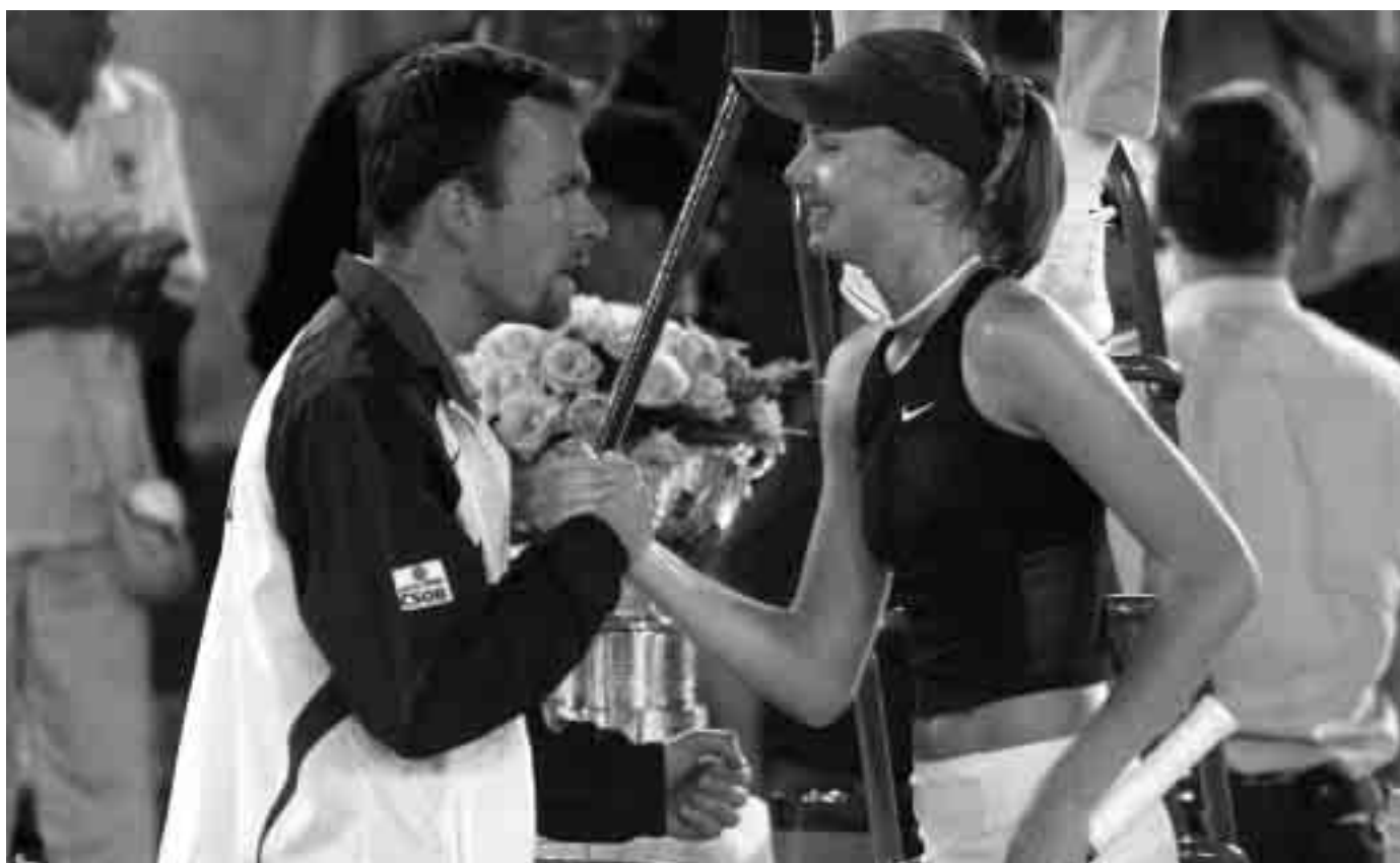
Hay que divertirse con el tenis para evitar "quemarse"